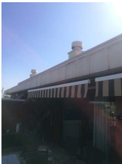
PASEO MALLORCA 5 A ÁTICO B PALMA